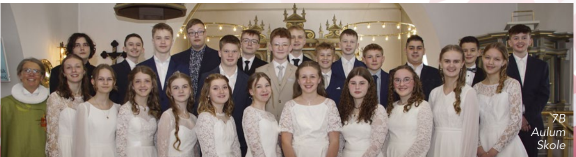
7B Aulum Skole