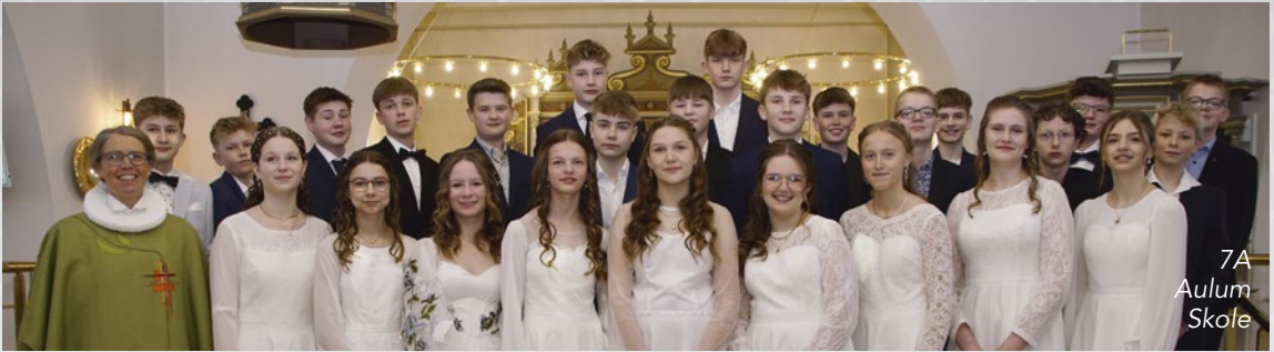
7A Aulum Skole